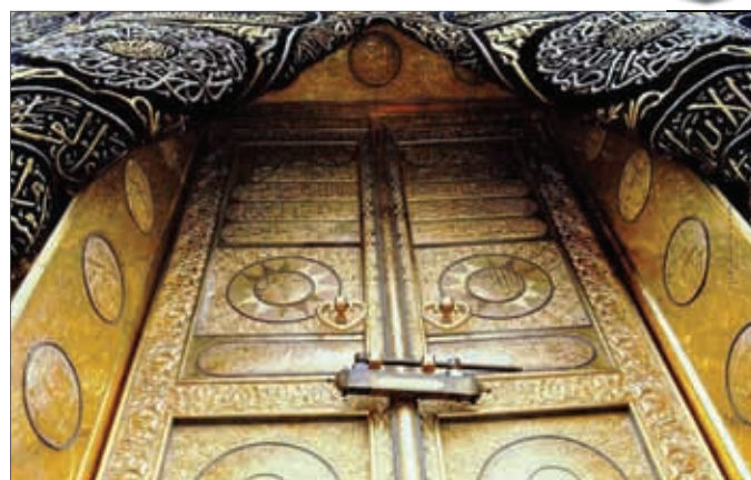
خداوند مرا برای رسیدن به خانه‌ات آماده ساز