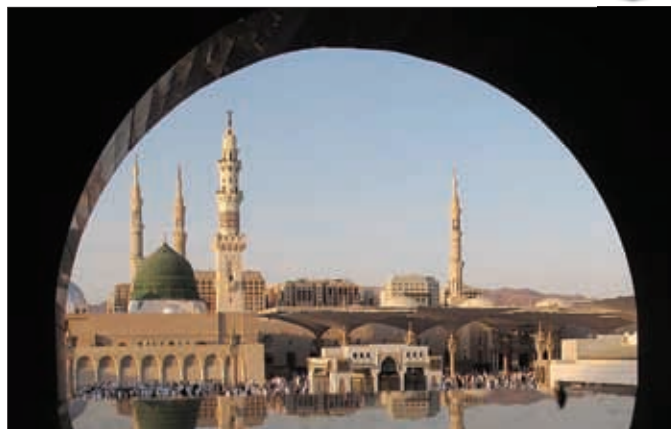
مسجدالنبی از زاویه‌ای دیدگر