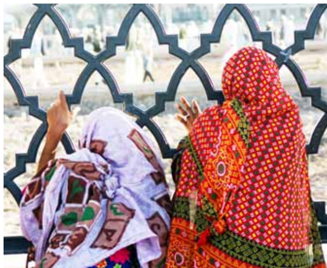
مدینه منوره - قبرستان بقیع