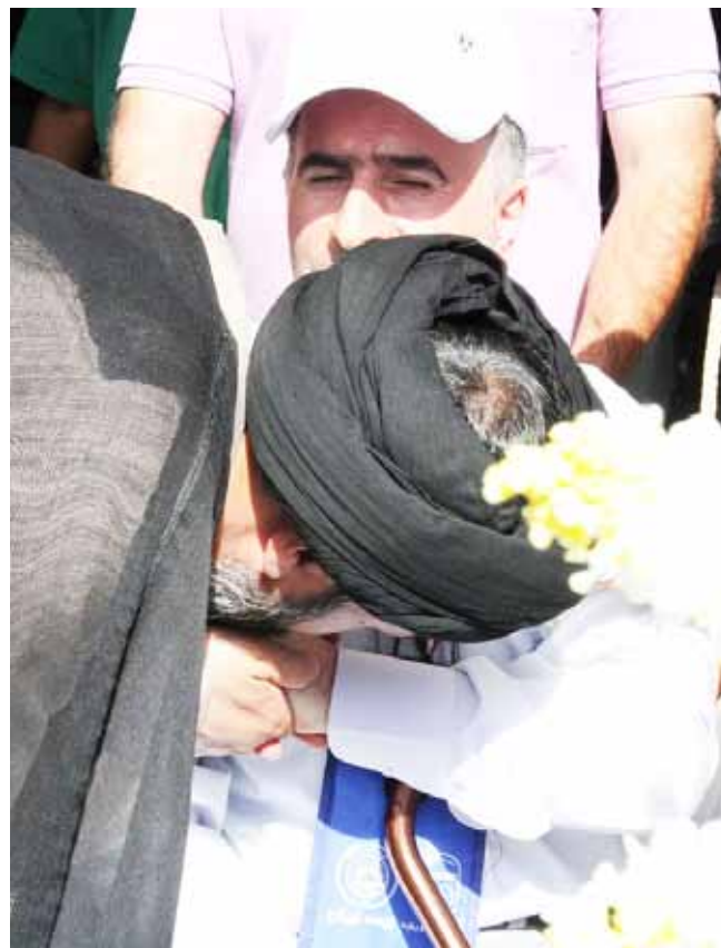
ورود کاروان زائران جانباز به مدینه منوره