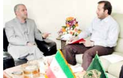
مهندس سعید اوحدی، رئیس سازمان حج و زیارت در گفت‌وگو با خبرنگار ستاد اطلاع رسانی حج ۹۲ در مدینه منوره، «اولین‌های حج ۹۲» را برشمرد:

سرپرست حجاج ایرانی با یادآوری اینکه شورای استفتاء بعثه معظم رهبری نیز شبانه‌روزی پاسخگوی زائران حرمین شریفین است، گفت: شرایط کاری در حج، غیر از شرایط کاری در تهران است و عزیزانی که به عنوان خدمتگزاران حج عازم شده‌اند، باید شبانه‌روز پاسخگو باشند.