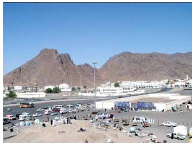
مدینه منوره - کوه احد و مزار شهدای احد حمزه عموی پیامبر (ص)