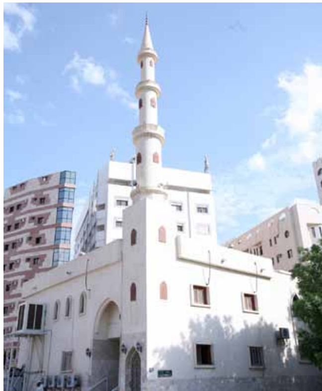
مدینه منوره - مسجد ابوذر