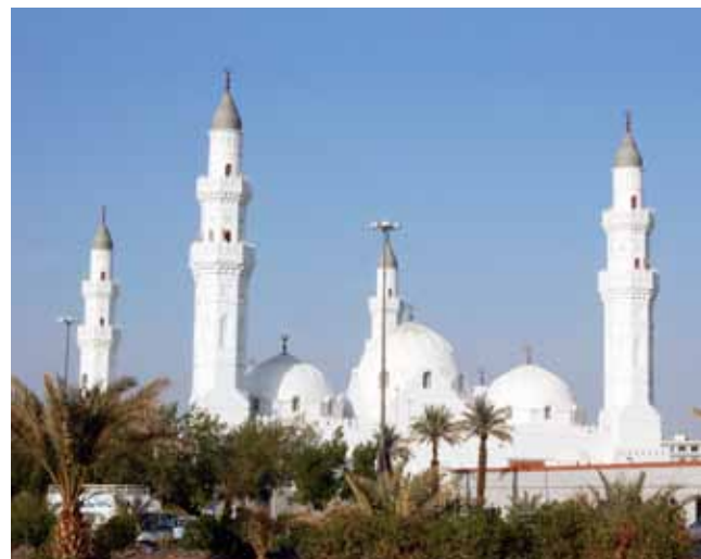
مدینه منوره - مسجد قبا