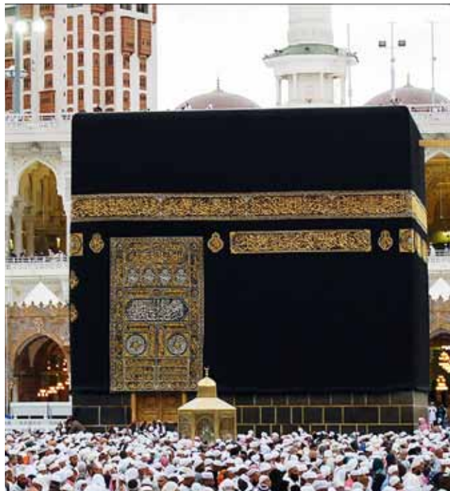
مکه مکرمه - مقام ابراهیم