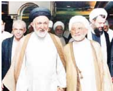
ابراز همدردی سرپرست حجاج ایرانی با مسلمانان زلزله‌زده بلوچستان پاکستان

روسای بعثه حج جمهوری عراق، بنگلادش و پاکستان با نماینده ولی فقیه و سرپرست حجاج ایرانی به طور جداگانه دیدار کردند.