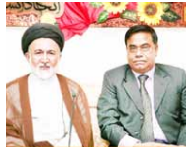
ادامه از صفحه اول

رئیس بعثه حج بنگلادش در مدینه منوره در پایان ضمن اعلام آمادگی برای استفاده از تجربیات ایران در زمینه حج و ارائه خدمات به حجاج، گفت: برای هر نوع همکاری و شرکت در کارگاه‌های آموزشی حج در کشور ایران آمادگی کامل داریم.