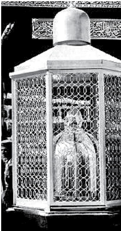
اختلاف نظریه های فقهی وجود دارد.