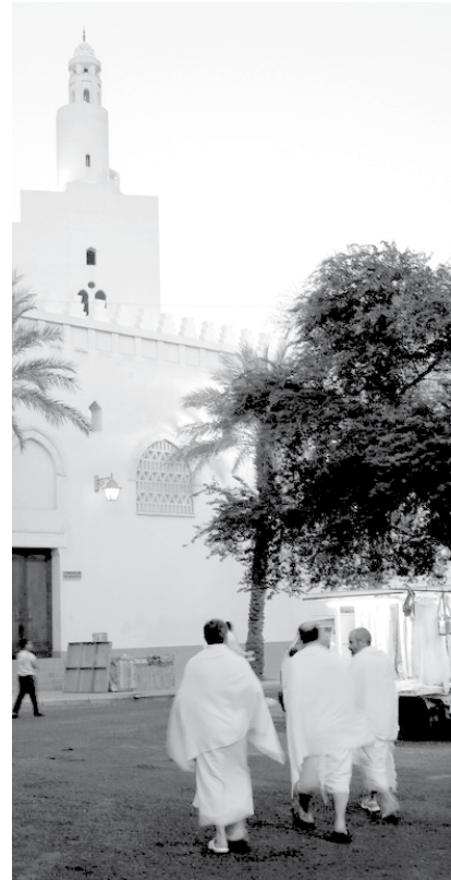
سرای حضرت آیت الله جوادی آملی

روزه گرفتن پرهیز از مستهبات است. همدلی و همدردی و هماهنگی با مستمندان است. یادآوری مسأله فشار گرسنگی و تشنگی بعد از مرگ است. روزه گرفتن هم منافع فراوانی دارد که منافع دنیایی (طبی) آن مشخص و منافع روحی و معنوی اش معین است. زکات که انفاق، تعدیل ثروت و رسیدگی به حال مستمندان و ضعیفان است. آنهم منفعت و مصلحتش مشخص است. جهاد و مرزداری و دفاع مقدس علیه تهاجم بیگانگان، منافع فراوانی دارد که پی بردن به آنها دشوار نیست. لیکن حج، یک سلسله از دستورات و مراسم و مناسکی دارد که پی بردن به راز و رمزش بسیار سخت است. معنای بیتوته کردن در مشعر، سر تراشیدن، بین صفا و مروه هفت بار گشتن و در بخشی از این مسافت هروله کردن و... راز و رمز