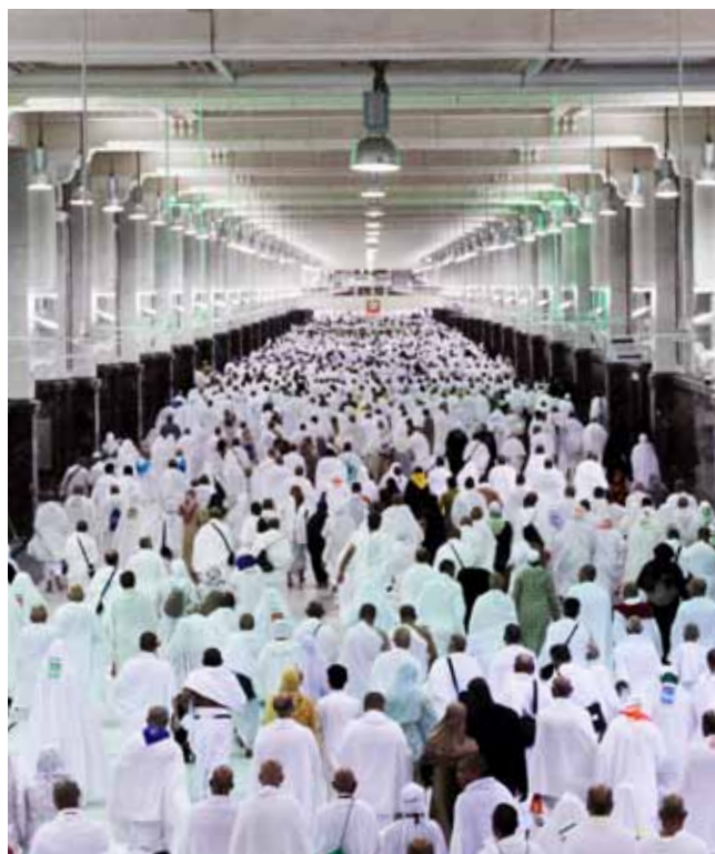
سعی صفا و مروه