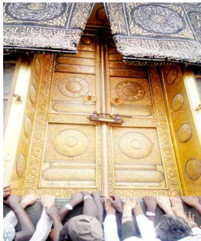
زائر کازرونی. کاروان ۲۴۰۰۹