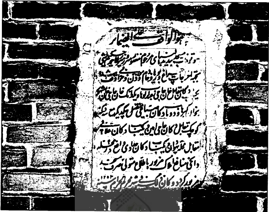
اطلاع متولی صرف مسجد