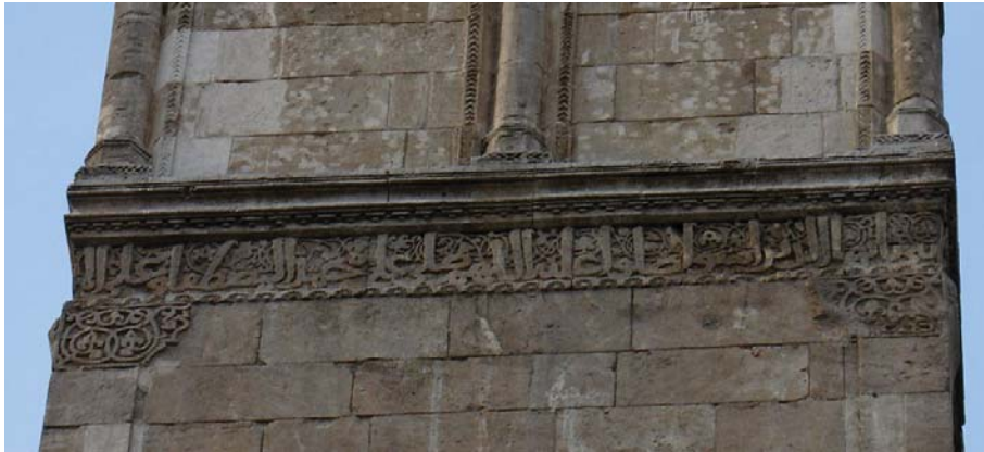
ضلع جنوبی کتیبه حاوی اسامی معصومین، در مناره مسجد جامع حلب

کتیبه‌های شیعی از قرن پنجم هجری در شمال سوریه/ احمد خامه‌یار