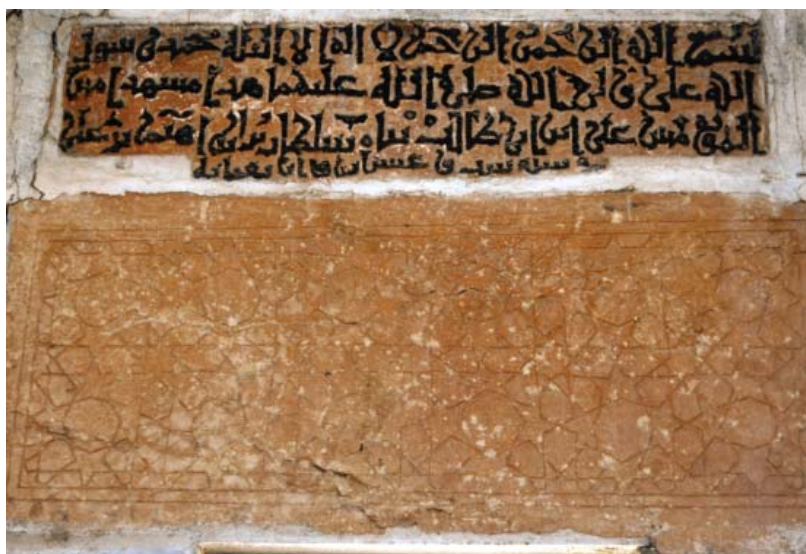
تزیینات و کتیبه سردر مشهد امام علی (ع) در معره مصرین