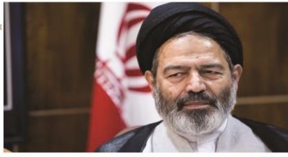
نماینده ولی فقیه در امور حج و زیارت در ویژه برنامه «عید غدیر»

نفوذی ها مانع تحقق انتظارات غدیری پیامبر (ص) از امت شدند