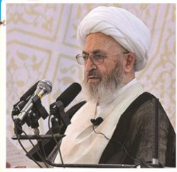
پیام ارزشمند مرجع عالیقدر حضرت آیت الله العظمی سبغانی، استمرار وظایف نبوت است مقام امامت